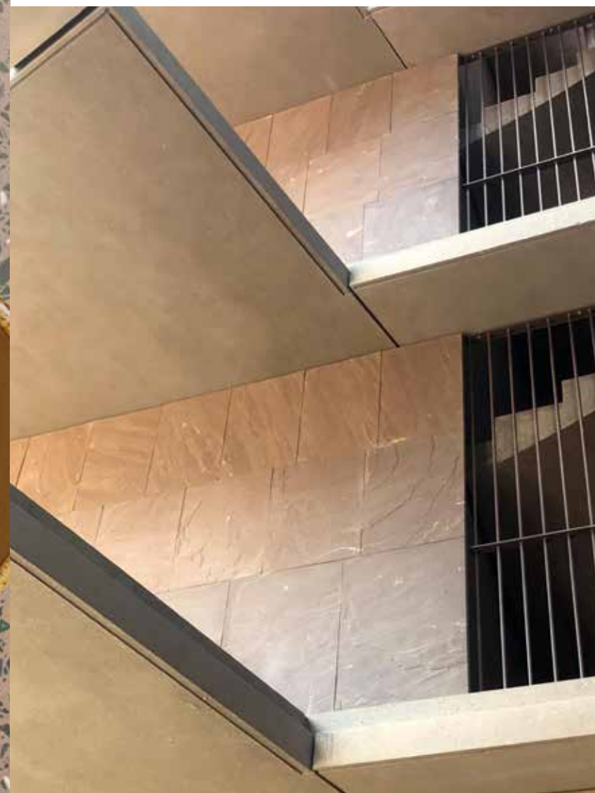
De monochrome gevelbekleding in donkerrode Indische zandsteen geeft het gebouw een fraaie uitstraling.

Het U-vormige woongebouw wordt geflankeerd door veel levend groen. De binnentuin, een ontwerp van Bureau Bas Smets, is publiek toegankelijk, maar de daktuinen zijn privé. De vrij massieve gevel en de lichte muren van de wintertuinen vormen samen een evenwichtig geheel. Het gelijkvloerse niveau is langs de kant van de Schelde en die van de Jos Smolderenstraat volledig opengewerkt. Dankzij deze doorwaadbaarheid komt de groene binnenruimte volop tot haar recht. ▶