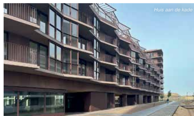
Huis aan de kade