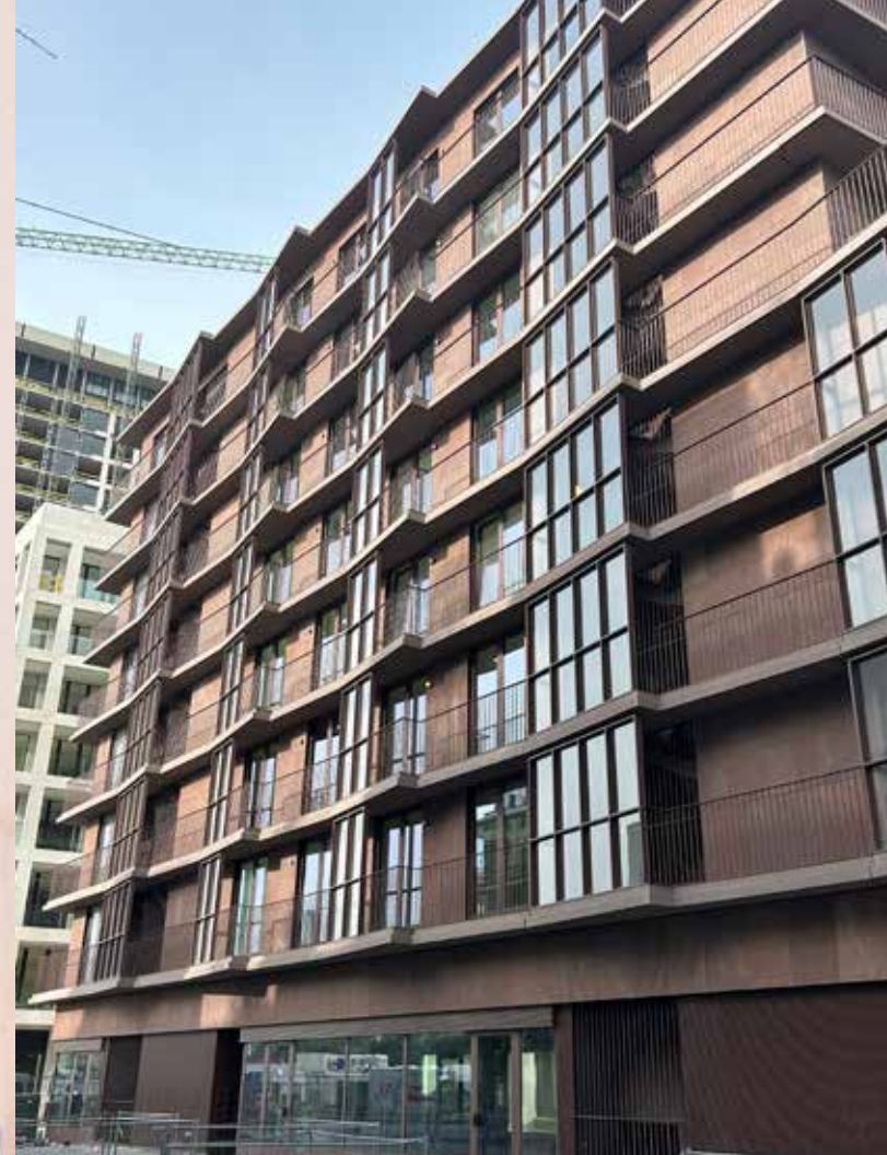
De kleur van het schrijnwerk sluit nauw aan bij die van de gevelbekleding.